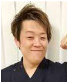
リハビリテーション科 重田

私は出張健康教室で上三川町の地域サロンへ参加しております。出張健康教室では、『フレイル』や『認知症』、『関節痛』についての説明や予防体操を実践しています。参加している中で「前も来てくれたよね？教えてくれた体操やってるよ！」「今日も楽しいお話しお願いね！」と、とても嬉しい言葉をいただくことがあります。緊張してしまう私には本当にうれしいお言葉でした。今でもその言葉や参加者の皆さんの笑顔を覚えています。出張健康教室に参加させていただき始めて数年、自分が中心となってお話することが多くなってきました。少しずつ自分の中でも慣れを感じてきたところではありますが、今後も慢心せず参加者の皆さんと楽しむことを忘れずに、地域の健康に貢献していきたいです。