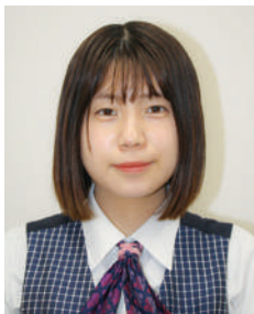
患者支援センター 神崎

地域の各サロンに出張講演で訪問しています。その際「痛みがよくなりました」や、出張講演が終わった後も「ぜひまた来てください」と声をかけていただくことがあります。そういった声を直接聞くことができ、本当に地域の皆さまに支えられ、愛されている病院だなと感じています。