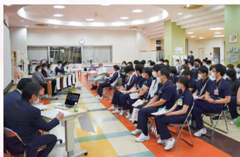
▲ 現地・ZOOMを合わせて約350名が参加しました。

令和5年11月27日に関東カマチグループ17病院の職員を対象にむすびプロジェクト研修会を開催しました。第2回目となった今回は、蒲田リハビリテーション病院を退院された患者様と退院後の支援に関わられた介護支援専門員・自立訓練事業所の理学療法士・訪問リハビリの作業療法士、地域の支援事業所スタッフ5名をお招きし、シンポジウム形式で開催しました。脳卒中を発症後に新規就労を目指している事例を通して、回復期リハビリテーション病院、地域の支援事業所との連携についての経緯や支援内容と今後の支援について、ご講義をいただきました。総勢350名程のグループ病院の職員が現地・Zoomにて集い退院後の地域の支援事業所との連携の大切さに関する知識を深めました。患者様の声を直接聞いたこともとても貴重な機会となりました。今後も患者様へのサービスの質の向上につながるよう研修会を企画していきます。