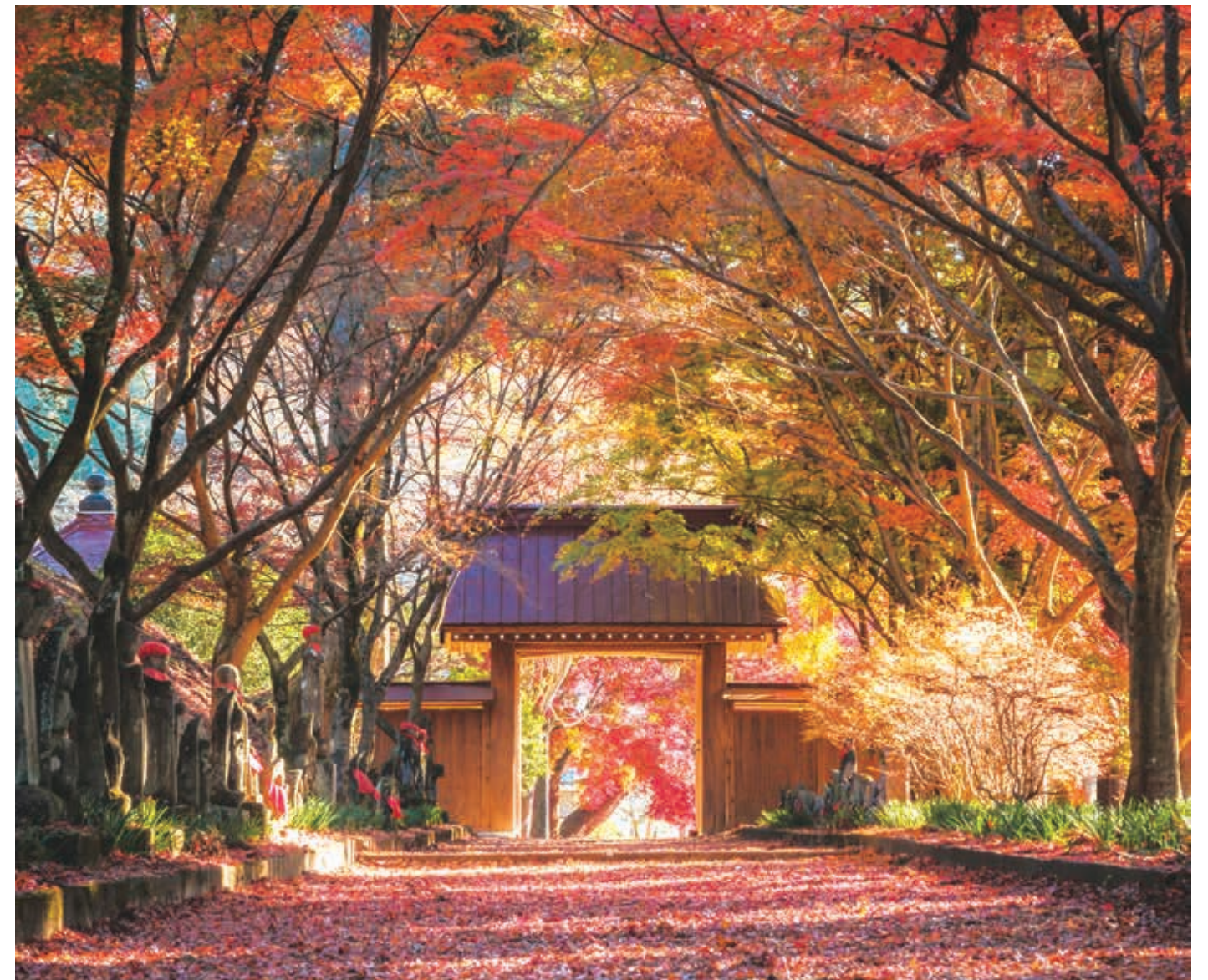
佐野市仙波町