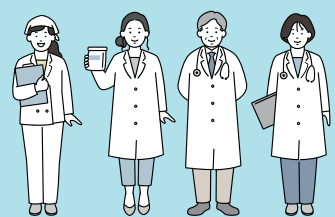
患者支援センター 薄根