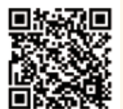
健康教室の予定は↑から!

今後の出張健康教室の予定を上記方法で検索が出来ます。また「お知らせ」にて、出張健康教室の様子を掲載しています。興味のある方は閲覧してみてください。